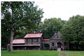
“北大農学部 第2農場 穀物庫”(北大文庫館所蔵資料)