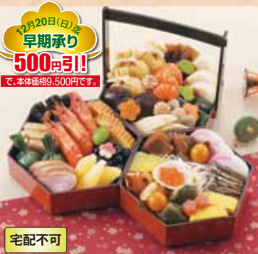
12月20日(日)迄 早期承り 500円引!! で、本体価格9,500円です。

おせち 23 京風おせち 八坂(やさか) (32品) お重外径 18.2×15.8×4.3cm×3 本体価格 10,000円