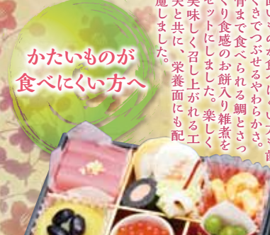
12月26日(土)~29日(火) 宅配お渡し日