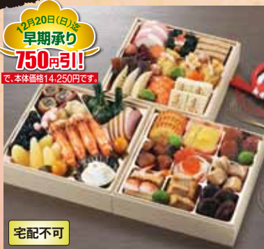
12月20日(日)迄 早期承り 750円引!! で、本体価格14,250円です。

おせち 22 京風おせち 桂(かつら) (37品) お重外径 20.2×20.2×4.6cm×3 本体価格 15,000円